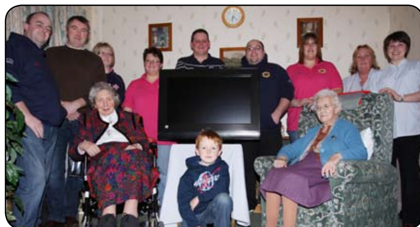
Cyflwynodd Clwb Moduro Llanbedr Pont Steffan a'r Cylch deledu 32 modfedd i gartref henoed Hafandeg yn Llanbedd. Codwyd yr arian drwy gyfarfodydd Autotests yn ystod y flwyddyn ddiwethaf.