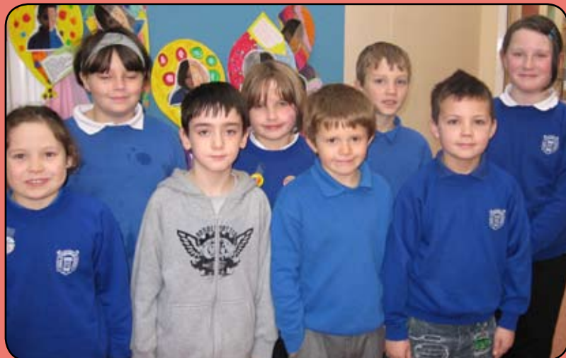
Timau Cwis Llyfrau Ail Iaith Ysgol Ffynnonbedr