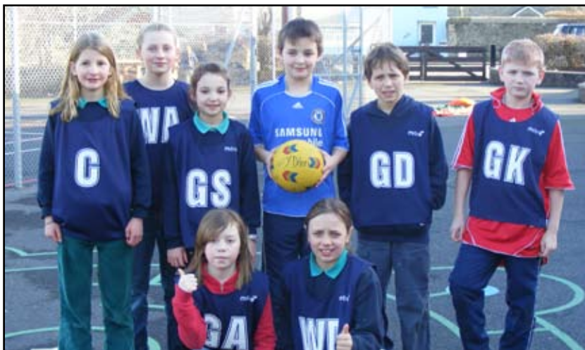
Tîm Pêl-rwyd Ysgol Y Dderi a fu'n fuddugol yn y Cylch.