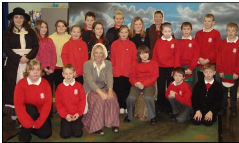
Disgyblion Blwyddyn 5 a 6 Ysgol Llanwenog gyda chast Merched y Gerddi yn Ysgol Cwrtnewydd