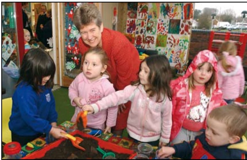
Y Gweinidog Addysg, Jane Hutt, yn ymweld ag Ysgol Ffynnonbedr.